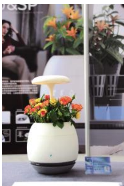
家庭用智能植物培养产品设计 沈成杰 指导教师 邢成恩