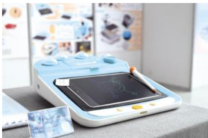
儿童心理理疗玩具设计 尹雪冰 指导教师 刘文杰