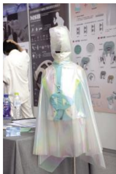
治未病——儿童家用保健仪设计 刘妍玉 指导教师 王建华