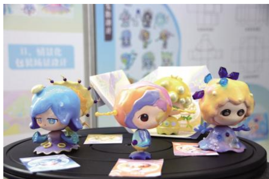
情景化“外星生物”主题盲盒设计 张楚伊 指导教师 李倩倩