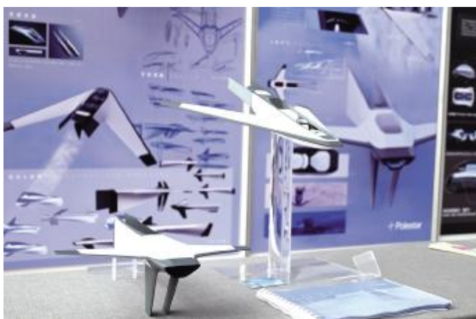
2035 年未来交通工具设计 赵金泽 指导教师 刘文杰