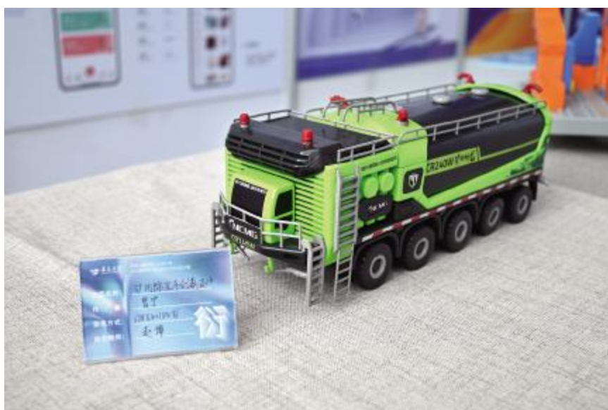
基于整合设计理论的矿用除尘车创新设计研究 曹宁 指导教师 赵博