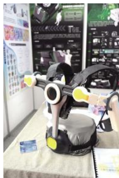
上肢无源助力外骨骼设计 武青正 指导教师 赵川