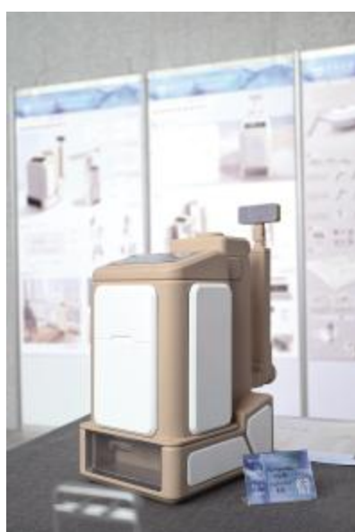
家用电动擦窗机设计 马雨晴 指导教师 姜勇