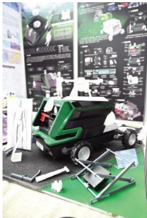
关于植保无人机的智慧农业产品设计 戴煜雅 指导教师 王昊辰