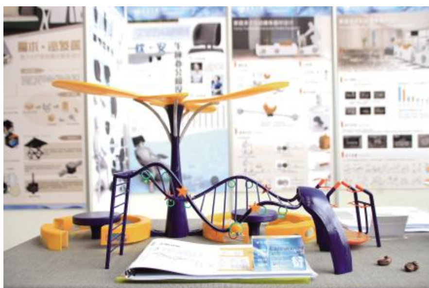
基于通用设计理念的户外公共健身器材设计 周冬雪 指导教师 赵川