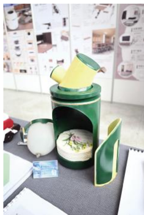
面向独居年轻人的积极独处产品设计 蒋笑轩 指导教师 王建华