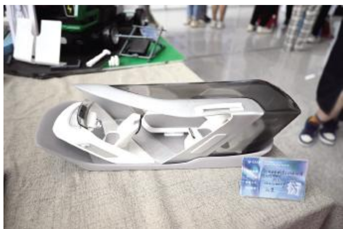
“Transpace”——针对未来城市上班族的无人驾驶汽车情感化体验设计研究 刘子涵 指导教师 孔斐