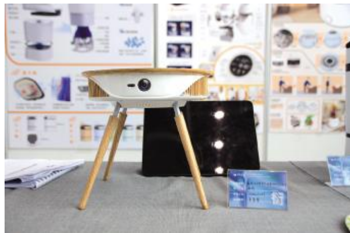
触控交互背景下投影仪创新设计 孟珂 指导教师 李倩倩