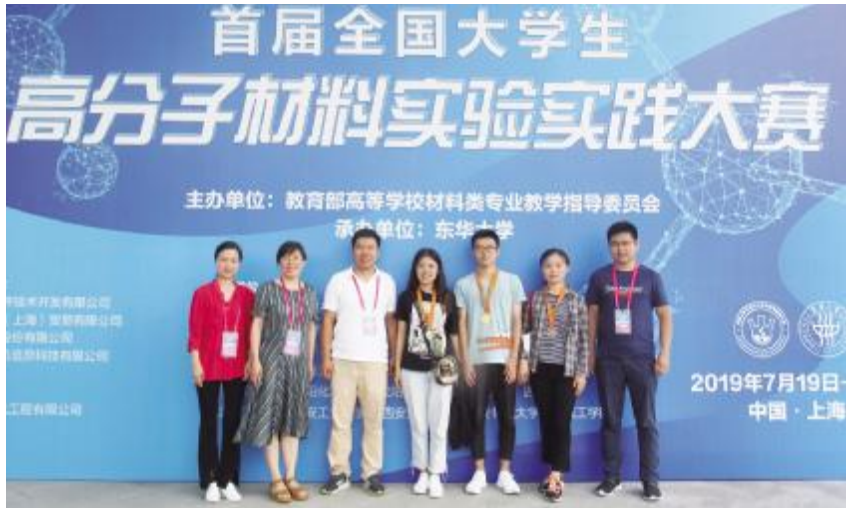
图为学院学生参加全国大学生高分子材料实验实践大赛获奖后,和老师一起合影留念。