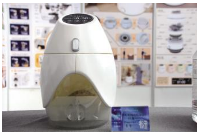
家用小型全自动饺子机设计 徐盈 指导教师 姜勇