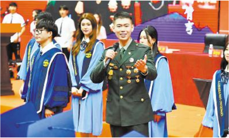
2023 年青岛大学毕业典礼

坚持系统策划上突出思想厚度，内容生产上突出表达深度，传播共鸣上突出现实温度，做到在新闻舆论策划上追求“精准滴灌”，在内容品质上追求“精雕细琢”，不断探索挖掘可以助力青年人成长成才的重大新闻选题。开展读书微思政行动，发布《2023