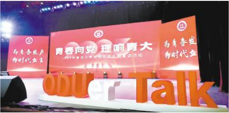
2023 年青岛大学双团双巡主题宣讲活动

年度学生阅读情况白皮书》，开设“书·悦享”“书·悦评”“书·悦诵”的等特色专栏，通过“真人图书馆”“有声