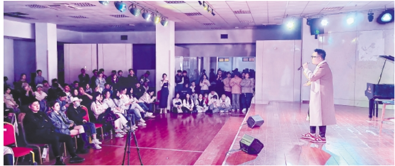
青大live house一周年活动现场

我登场,他们风格各异,各有特色,有的以抒情歌曲抒发内心深厚而细腻的情感;有的唱着对唱情歌,洋溢着幸福和甜蜜;有的则是动感旋律,带动观众的感官和肢体。歌曲有限,热爱无限。