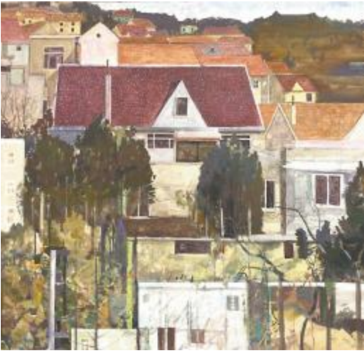
《宿丘》作者:胡姬丞 尺寸:80×80cm 水彩画 2024 年