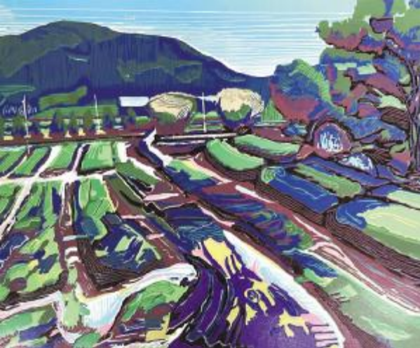
《崂山的茶园》作者:刘镇境 尺寸:56cm×45cm 套色木刻 2024 年