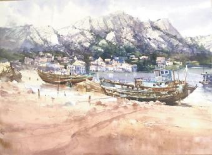
《青山渔村码头》作者:解清洁 尺寸:76cm×4cm 水彩画 2024 年