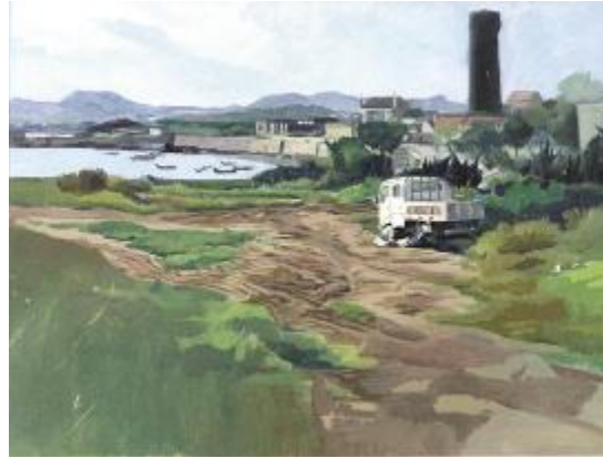
《公鹅嘴场景》 陈志恒