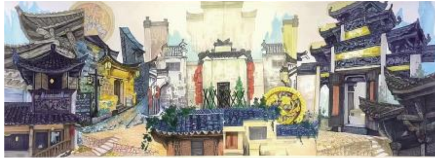
《繁华》 王胜楠, 106.4x38.2cm, 马克笔