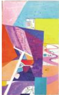
《色块泾县》 宋呈昱, 30x50cm, 油画棒