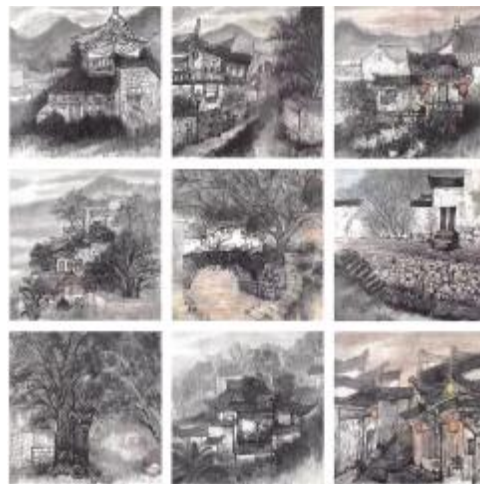
《古韵徽州》 李瑞雪, 尺寸 66x66cm