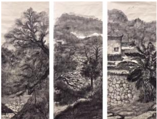
《墨韵徽州》 陈俊文, 尺寸 110x150cm