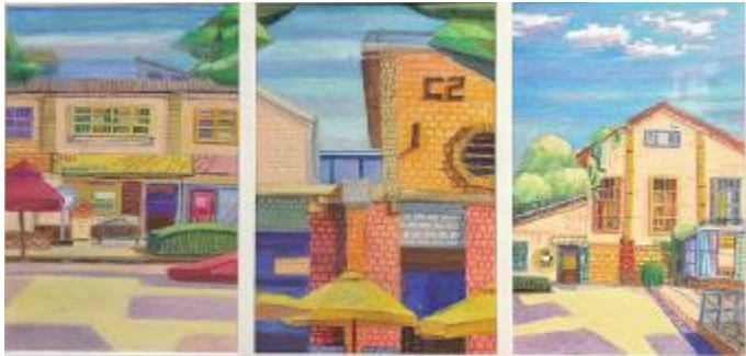
《色彩景德》 查玉俊, 44x90cm, 油画棒