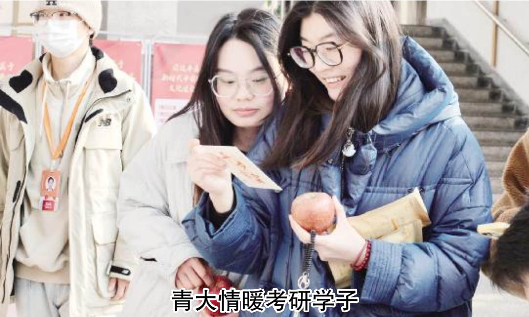
2024 年研究生考试已进入倒计时,日前党委宣传部、党委学生工作部和图书馆联合主办“‘研’途相伴,‘苹’安上岸”主题活动。在浮山校区和金家岭校区,考研学子可在指定地点的心愿墙写下自己的愿望,并领取一颗苹果和一张手写明信片。除了学校送上的祝福,各学院(部)也以各种学生带给考研学子鼓励。

人民银行省分行王兆旭分别作了题为《生物多样性保护相关知识及要求》《生物多样性金融倡议的全球格局》《基于“绿资产”的绿色金融体系建设》《我国生物多样性金融的探索实践》的主旨报告。 活动由省生态环境规划研究院、省金融学会和我校共同主办,经济学院承办,来自联合国开发计划署驻华代表处生物多样性金融项目指导组、生物多样性金融项目指导委员会成员单位、中央财经大学绿色金融国际研究院、省金融学会部分会员单位、山东省生态环境规划研究院、日照水库 EOD 项目相关单位等专业人士、学者以及驻青高校师生 90 余人参加活动。(宣文)