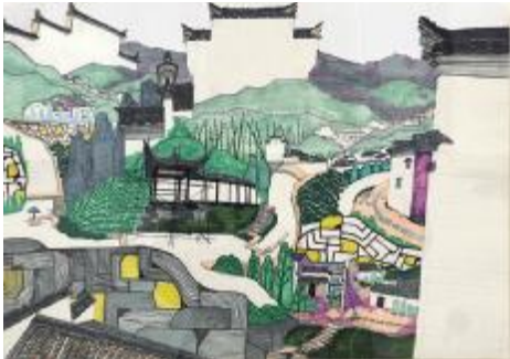
《查济》 杨传浩, 53.2x37.7cm, 综合材料