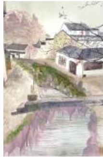
《秋日》 刘斐, 26x37cm, 综合材料