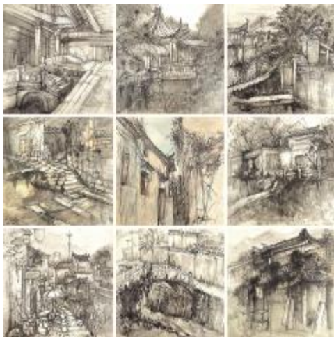
《踱步·壹济》 张竞文, 140x140cm