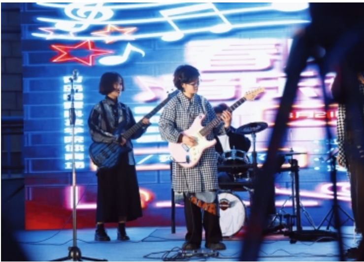
白兰地乐队在演出中