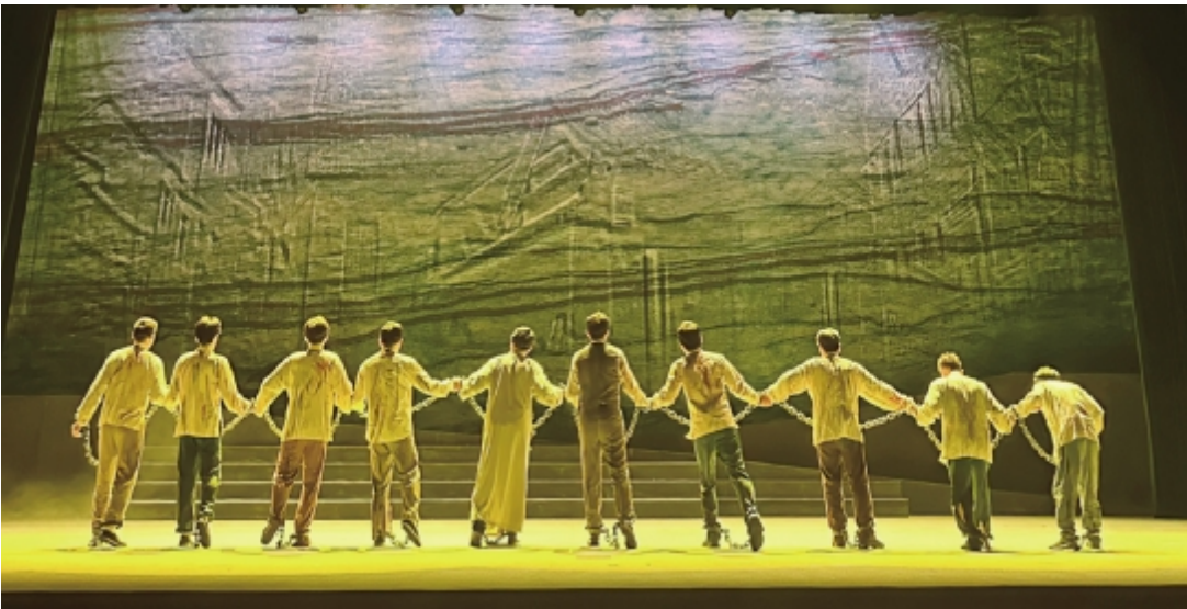
话剧《暗夜之光》首演现场

本报讯 11月10日晚,红色文化进校园暨话剧《暗夜之光》首演活动在校剧院举行。活动由中共平度市委宣传部、平度市文联、青岛市红色文化研究会和我校共同主办,山东省话剧院演出。校党委副书记肖江南出席活动并致辞。 中宣部原秘书长、中国戏剧家协会副主席官景峰,全国政协常委、国家一级美术师、联合国文明联盟艺术家代表王林旭,刘谦烈士后代杨冬梅、杨密,中国外文局亚太传播中心总编辑赵超,山东省话剧院党委书记叶树茂,苏州宏歌影视文化公司董事长苏勇亮,青岛市委宣传部副部长、市文明办主任张升强,海尔集团原党委副书记、青岛市红色文化研究会党建研究顾问王安喜,平度市委书记赵兴绩,平度市委常委、宣传部部长夏嵩,平度市委常委、市委办公室主任宋振祥,平度市人大常委会