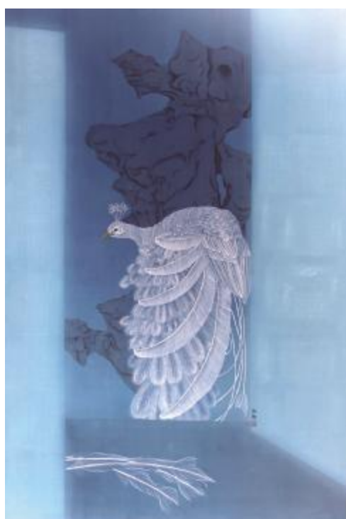
《蓄力》杨晨妍 180cm×120cm 工笔绢本 指导教师: 赵雨瀛