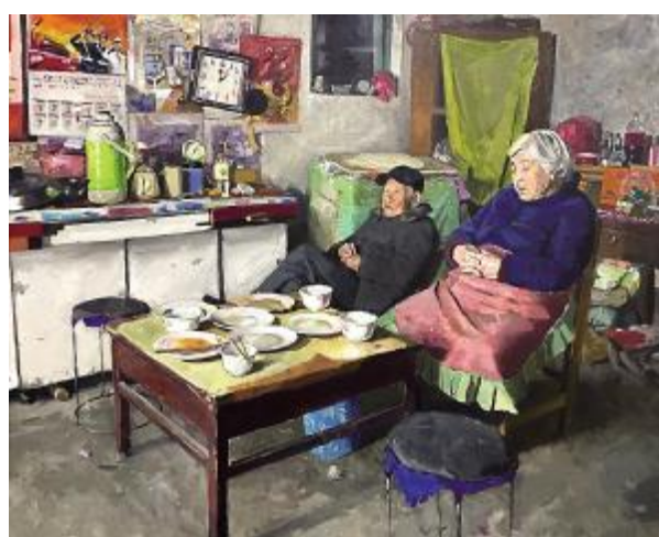
《空盘子》张兆财 140cm×170cm 油画 指导教师: 杨福运