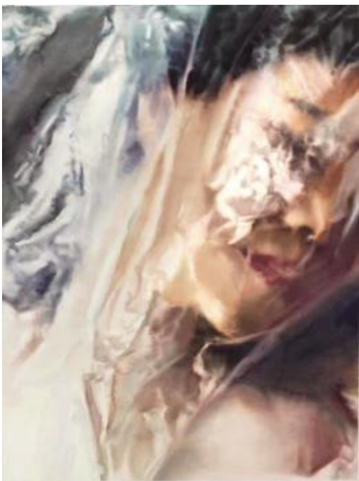
《溺》系列三 解清洁 108cm×78cm 纸本水彩 指导教师: 王绍波