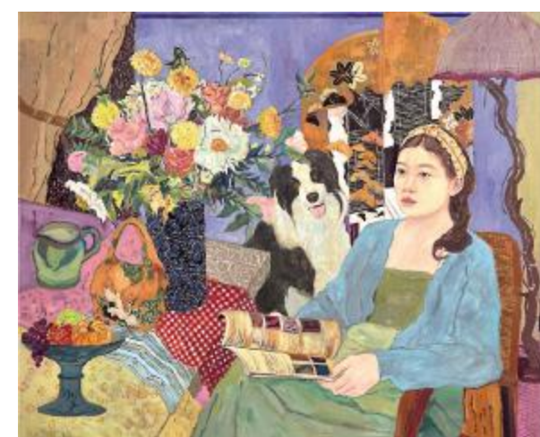
《怀·春》董雨晨 100cm×120cm 油画 指导教师: 徐青巍