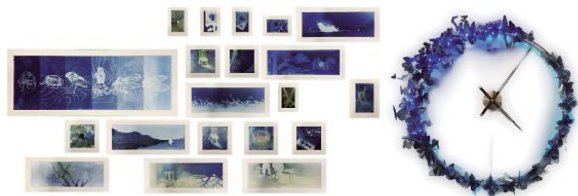
《鸣蛩》魏舒凡 270cm×80cm 蓝晒综合技法 指导教师: 历晓东