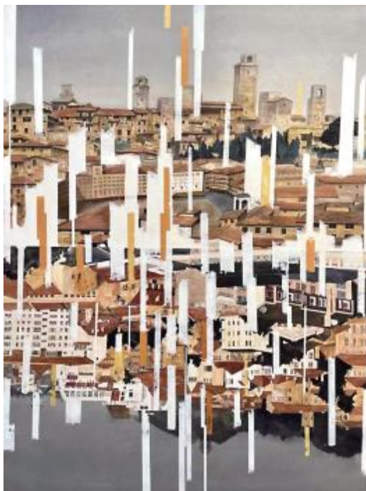
《双城记》庞静宜 148cm×110cm 纸本水彩 指导教师: 王先明