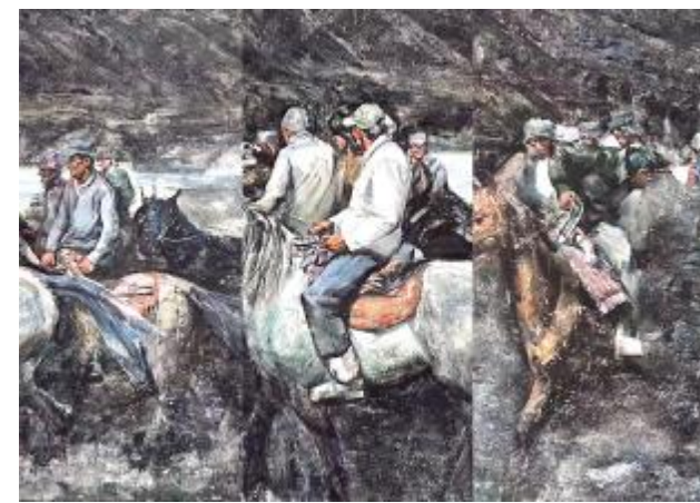
《牧羊·1》李修政 120cm×180cm 综合材料 指导教师: 李同舟