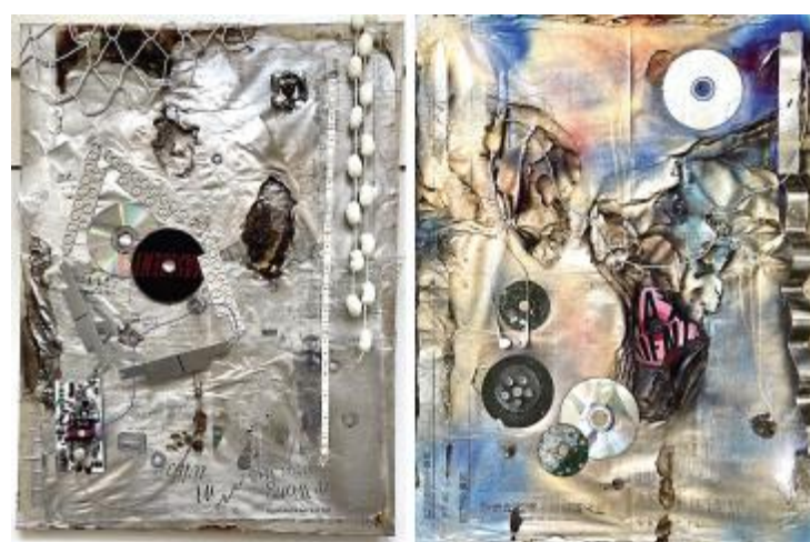
《景观》王欣 80cm×60cm 综合材料 指导教师: 孙小娥