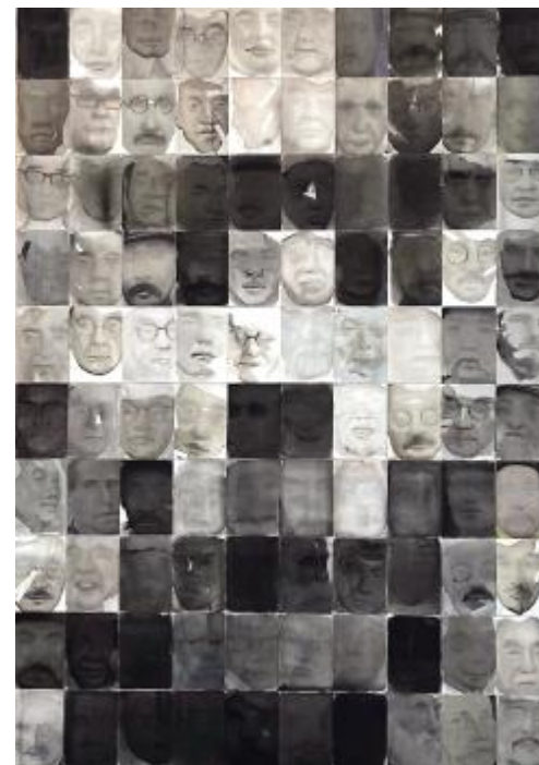
《浮生如寄》马鑫 150cm×105cm 纸本水彩 指导教师: 王先明