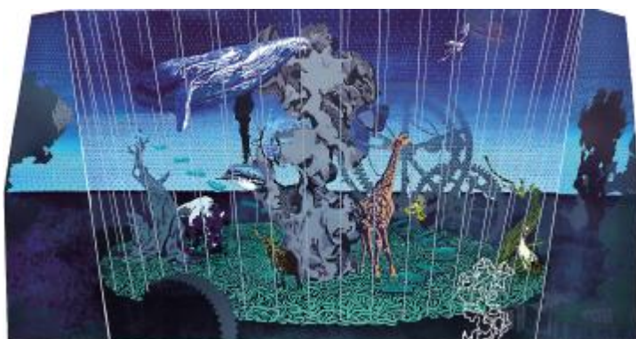
《和光同尘》刘镇境 130cm×70cm 套色木刻 指导教师: 历晓东