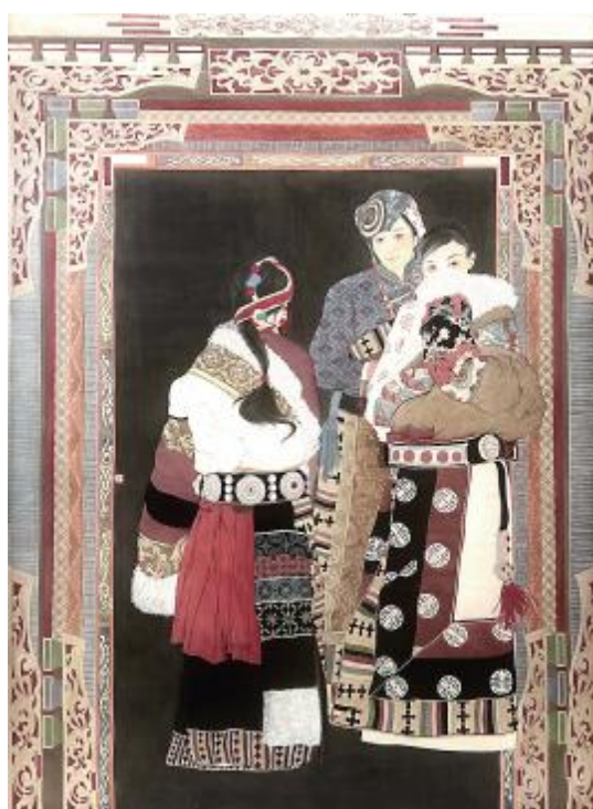
《遇》王迪玉 160cm×220cm 工笔绢本 指导教师: 元文平