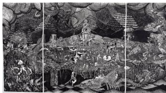
《浑浑有始 ∞ 沌沌无终》谷可心 180cm×100cm 黑白木刻 指导教师: 张道宏