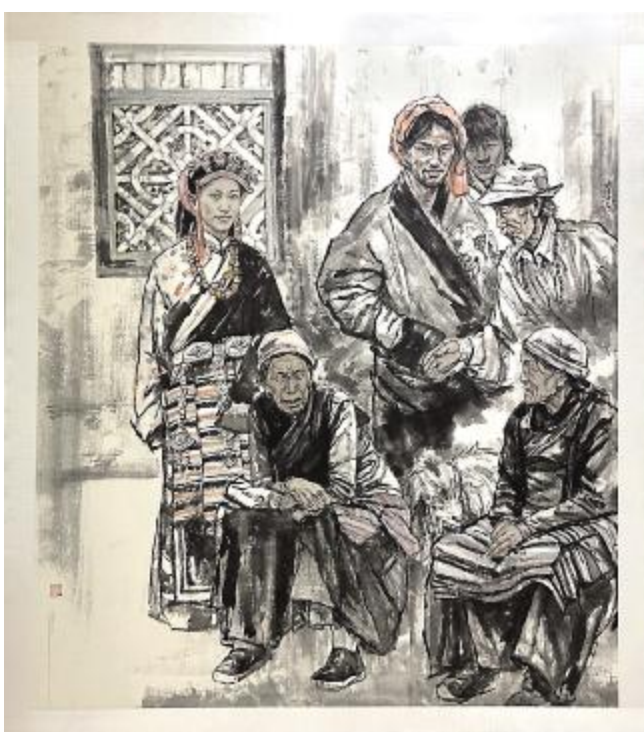
《扎西德勒》曹汉涛 197cm×170cm 纸+本彩墨 指导教师: 李国柱