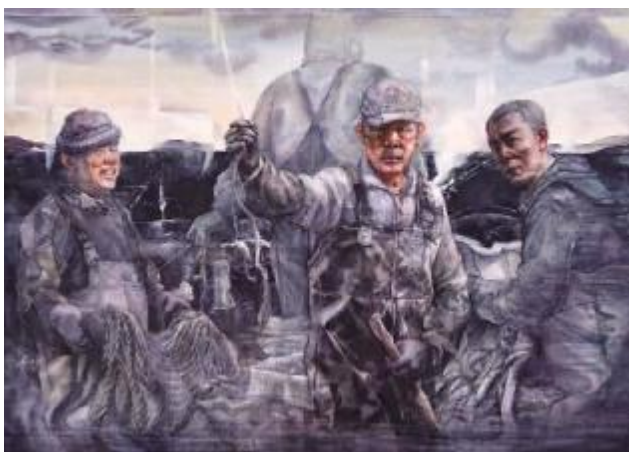
《渔系列二》刘存敏 150cm×105cm 纸本水彩 指导教师: 樊凤至

五月,是夏花芳菲的季节,青春悄然绽放。在这样一个美好的时节,我们迎来了青岛大学合并办学三十周年校庆。