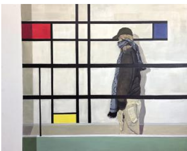
《回·声》高松 150cm×120cm 布面油画 指导教师: 孙小娥