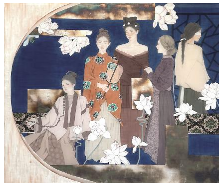
《中国风·古风荷韵》刘双 169cm×199cm 工笔绢本 指导老师: 元文平