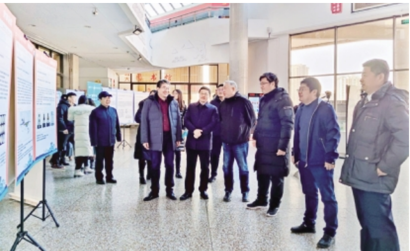
图为学院举行学术交流年会。

2022年全国硕士研究生招生录取工作落幕,环境科学与工程学院再一次创造了亮眼的考研成绩:本科毕业生117人,70人达到国家线,达线率59.8%;64人考入国内外大学或科研院所,录取率达到54.7%;考入“双一流”高校及中科院的学子45人,占录取总数的70.3%。有志学子们走向更广阔的天地,开启崭新的科研之路。