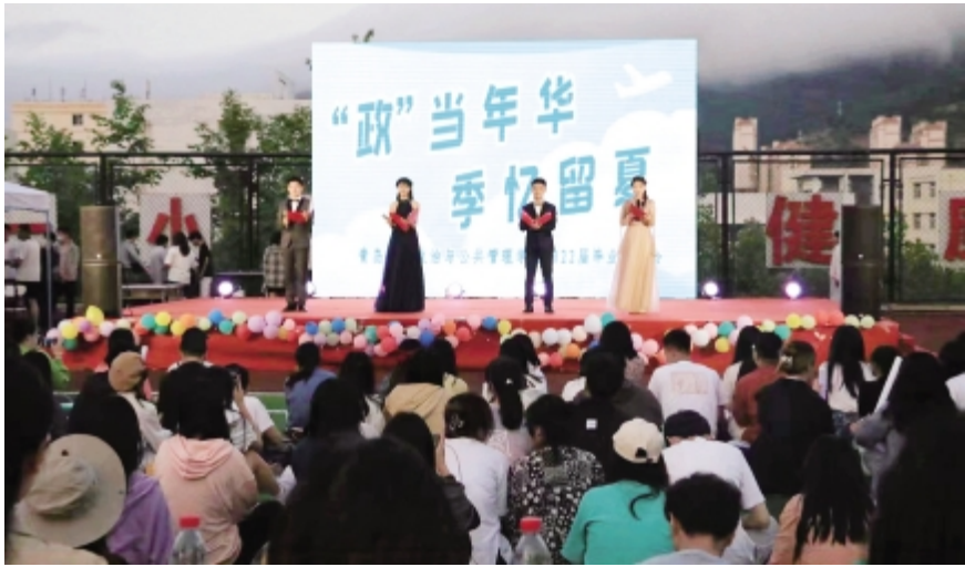
燕雀相送,锦绣前程。近期,各学院毕业生离校各项工作接近尾声,各学院也举行了形式多样的毕业晚会,为毕业生送行,为在校生鼓劲。图为 6 月 5 日我校政治与公共管理学院在金家岭校区举行的各年级同学共同参与的毕业晚会现场。