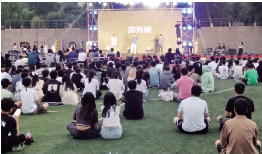
“星火燎百年,青年唱今朝”——“Dr.U 博士杯”青岛大学第八届“我是歌手”歌王之夜,于 6 月 12 日晚六点半滢园操场举行。经过多轮角逐,共有八组选手脱颖而出,成功晋级歌王之夜。图为“我是歌手”比赛现场。