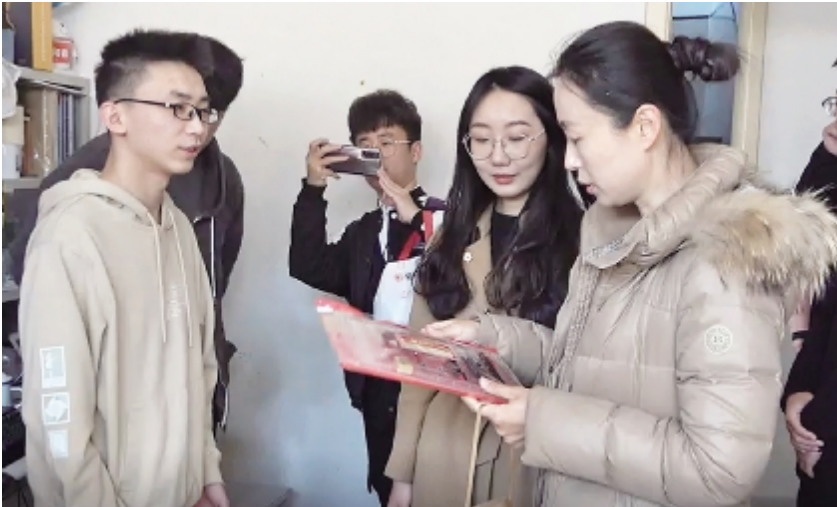
图为研究生考试前夕,学院有关领导为学生送去橙子和文具,祝学子心想事成(橙)、马到成(橙)功。

情发生以后,学院坚持“不停学”“不停研”“畅通”,在各项防控措施做到的前提下,更加精心安排教学工作,尽力实现“防疫不松懈,教学不打折”的目标。教师通过QQ群、钉钉群、微信群等软件,积极开展网络教学,指导学生学习,并通过线上答疑和辅导、批改作业等环节,全面监管学生学习,让学生“学习有保障,听课有效率”。与学生家长实时沟通,不仅做到“屏”对“屏”,“键”对“键”,更做到“心”贴“心”,“情”连“情”。同时,由于疫情,很多学校的复试改为线上,材料学院为了让同学们在复试中更好的展现风采,打造了16间升学就业面试室。在手机支架、网络接口等硬件外,材院还配备了矿泉水、镜子、湿巾等生活用品。为加强同学们对考研信息的深入了解,材院老师对于每位学生的情况进行了“一对一”“多对一”的指导帮扶。办考研动员大会,建立11所院校考研互助群,多次举办考研经验交流会、考研就业专题推进会,联系4名学院优秀的专业课老师进行超120课时的专业课辅导。除专业性辅导外,材料学院还会为同学们提供解暑物品、开设心理讲座,关怀学生的身心健康。“给我们大学四年划了一个非常完美的句号,让我们能够在青岛大学度过了最后一段最美好的时光。”同学们纷纷表示。