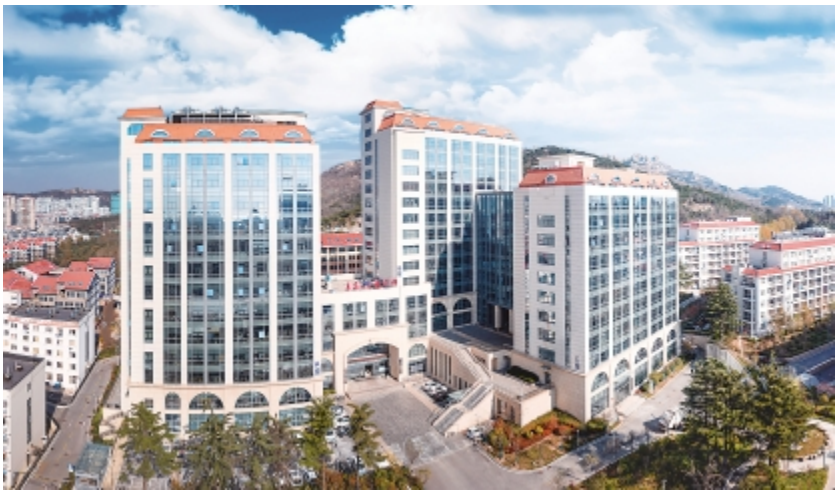
图为医学部大楼外景。

教海,与专业课一样不容马虎的实验课程,贴近临床的见习实习,才使我因为扎实过硬的专业知识基础和临床技能,在人才济济的北医推免复试中脱颖而出。”